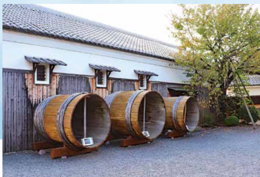
伏見/月桂冠大倉記念館

醍醐寺 は、豊臣秀吉が「醍醐の花見」を催した桜の名所。琵琶湖疎水の一部である 山科疎水 沿いの遊歩道は多くの人に親しまれています。