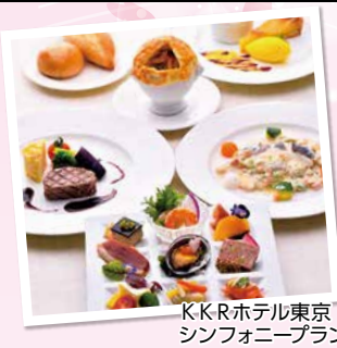
KKRホテル東京 シンフォニープラン