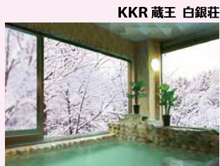
KKR 蔵王 白銀荘