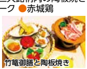
竹籠御膳と陶板焼き

条件 2/10~3/30/ 1室1名様利用は プラス1,500円/洋 室・和室・和室ツ イン・和室ツイン 利用は別料金