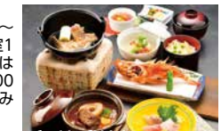
牛シチューとかさごの唐揚げ付会席

条件 2/10~ 3/31/1室1 名様利用は プラス2,000 円(平日のみ 利用可)