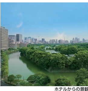
ホテルからの景観