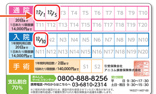
※「どうぶつ健康保険証」裏面のイメージ

通院・入院の限度日数がありますので、対応病院の窓口での精算、弊社へ直接ご請求いただく場合等、保険を利用した際には、保険証の裏面に記入いただき、日数の管理をお願いします。 ※通院・入院の利用日数が各15日を超えた場合、窓口での精算はできませんので直接弊社へ保険金をご請求ください。